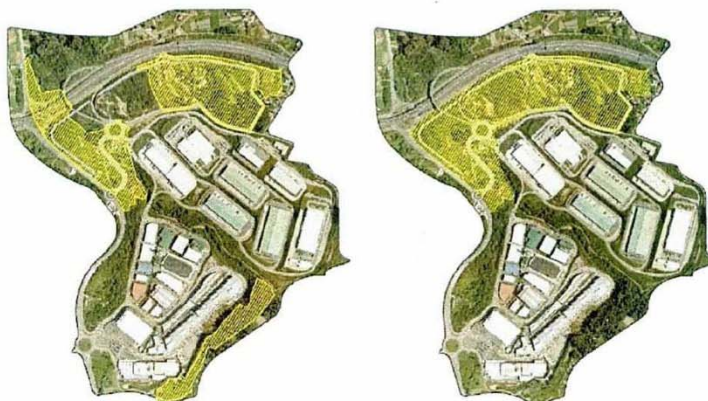
Ampliación prevista no PSOAEG e proposta no Proxecto sectorial.

Proposta: establécese unha nova delimitación partindo do ámbito recollido no PSOAEG para a ampliación do parque existente, denominado de Valadares (255.365 m 2 ). Suprímese o ámbito previsto ao norte da VG-20 e os terreos situados ao sueste, para favorecer a configuración dun espazo continuo. Incorpora varias parcelas recollidas no plan parcial do parque tecnolóxico e loxístico de Vigo (parcela 18 equipamento privado e parcelas 24 e 32 de zonas verdes) que non foron desenvoltas.