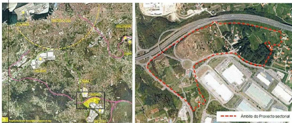
Ámbito da ampliación prevista

Ámbito de actuación: terreos lindeiros ao Parque tecnolóxico e loxístico de Vigo, comprendidos entre a vía de alta capacidade VG-20 e a Avenida Clara Campoamor, pertencentes ás parroquias de Beade e Valadares. Atópanse a uns 5 km ao suroeste do centro urbano de Vigo.