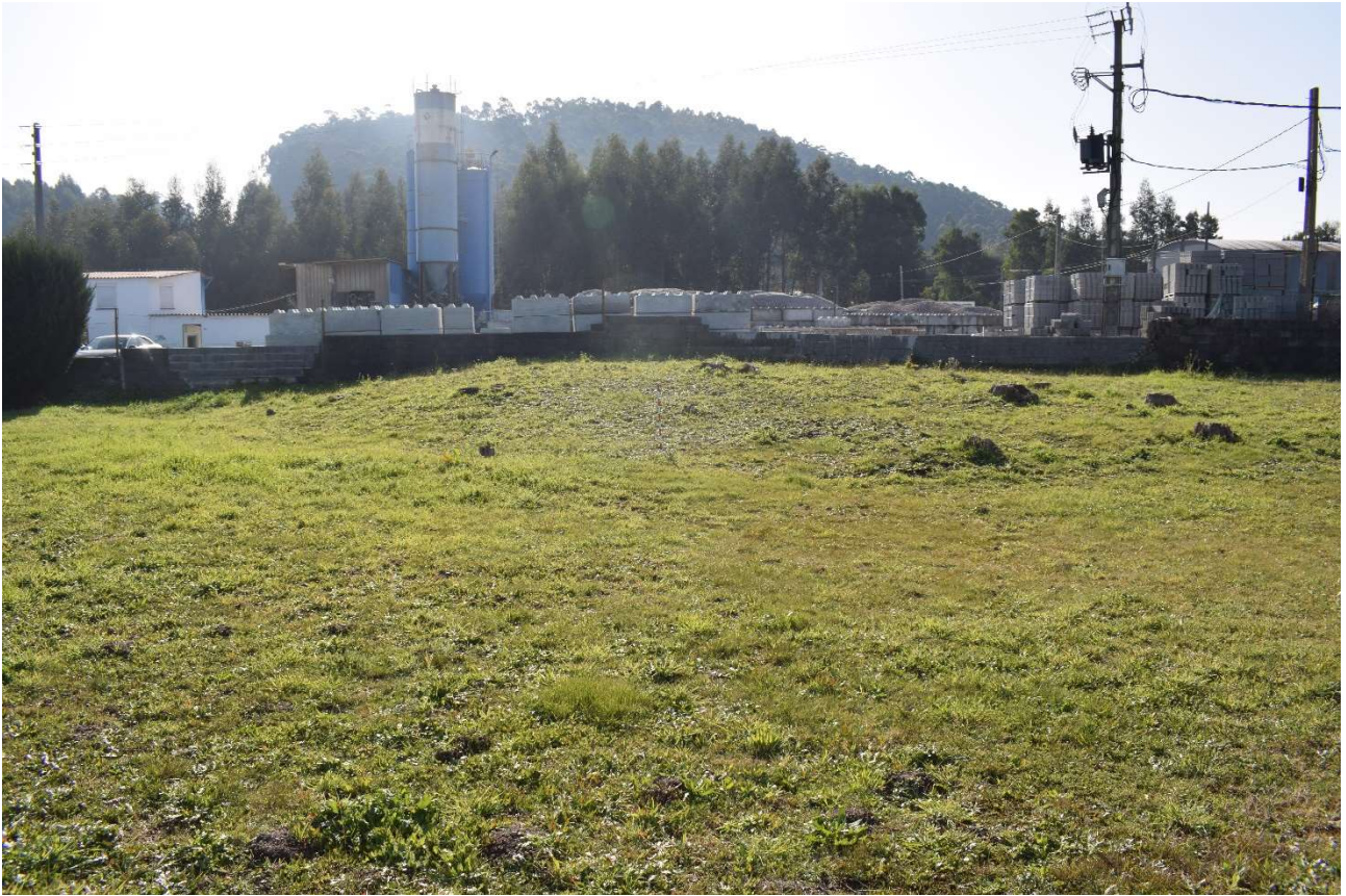
Mámoa de Tomada de Martínez 2 (GA36004018) desde o norte. obsérvase a presenza de tocóns de arborado na zona noroeste que desvirtúa a morfoloxía do túmulo