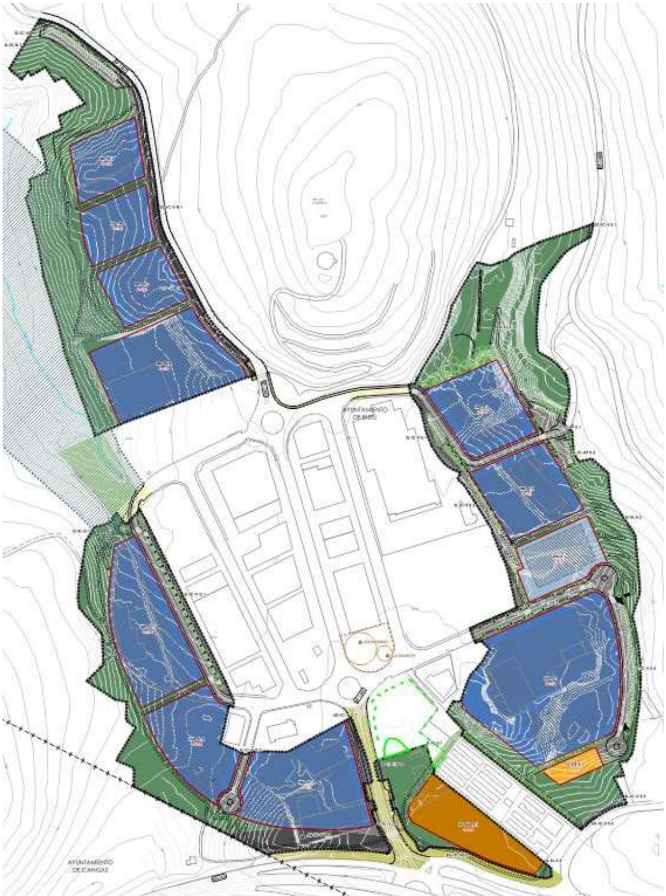
Proposta de redefinición do Entorno de Protección da Mámoa de Tomada de Martínez 2