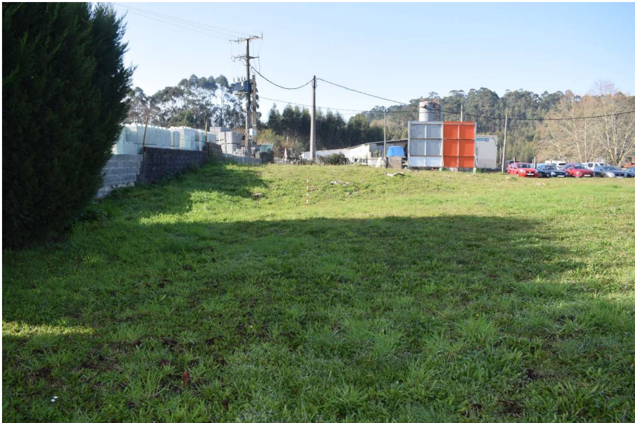
Mámoa de Tomada de Martínez 2 (GA36004018) desde o leste. Obsérvase o corte da mámoa polo seu sur debido á implantación do muro de peche da planta de cemento