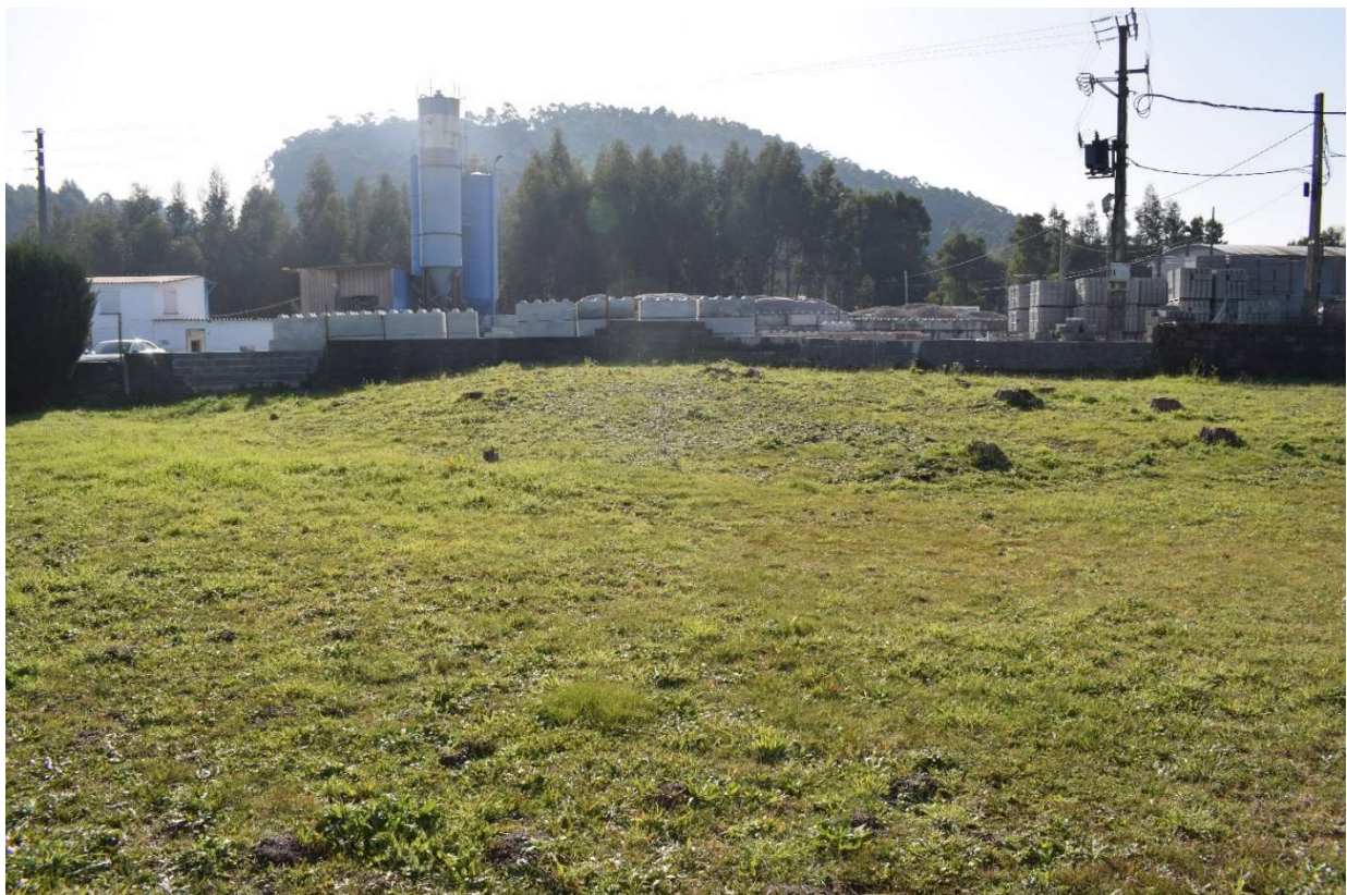
Mámoa de Tomada de Martínez 2 (GA36004018) desde o norte. obsérvase a presenza de tocóns de arborado na zona noroeste que desvirtúa a morfoloxía do túmulo