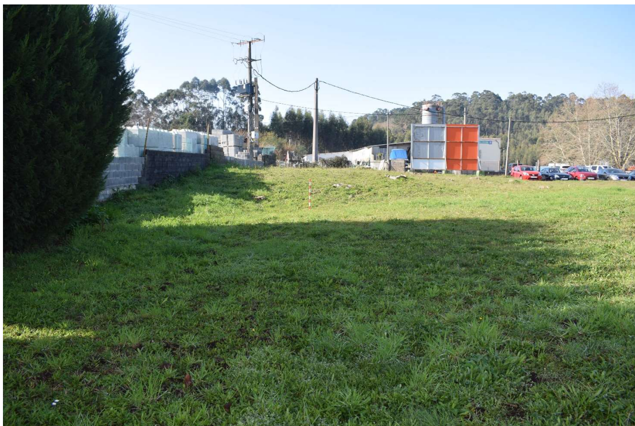
Mámoa de Tomada de Martínez 2 (GA36004018) desde o leste. Obsérvase o corte da mámoa polo seu sur debido á implantación do muro de peche da planta de cemento

Todo este conxunto de actuacións, sumado á existencia do tanatorio e do parque de bombeiros ao leste do túmulo e dentro do Entorno de Protección establecido no PXOM de Bueu, configura un espazo altamente alterado pola urbanización do parque empresarial.