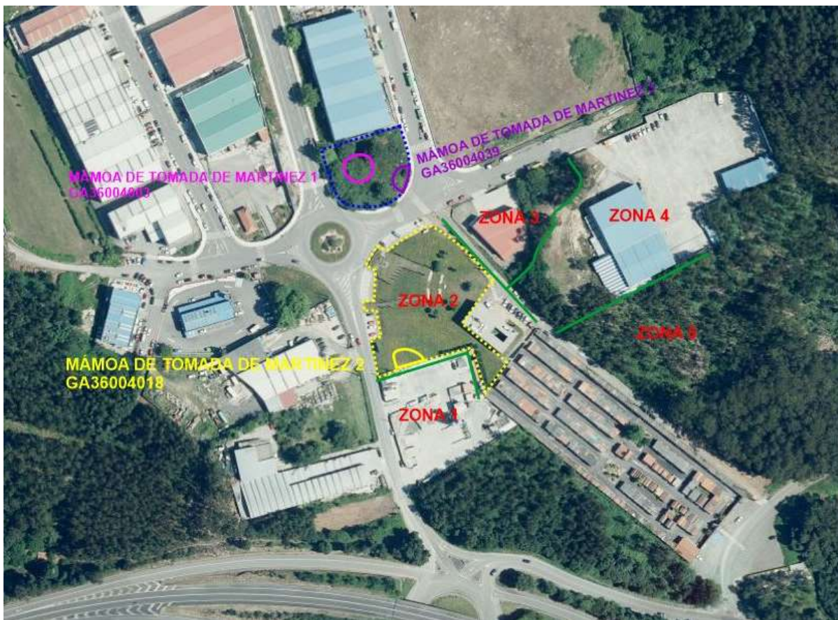
Proposta de redefinición de entornos de protección (PNOA 2020)