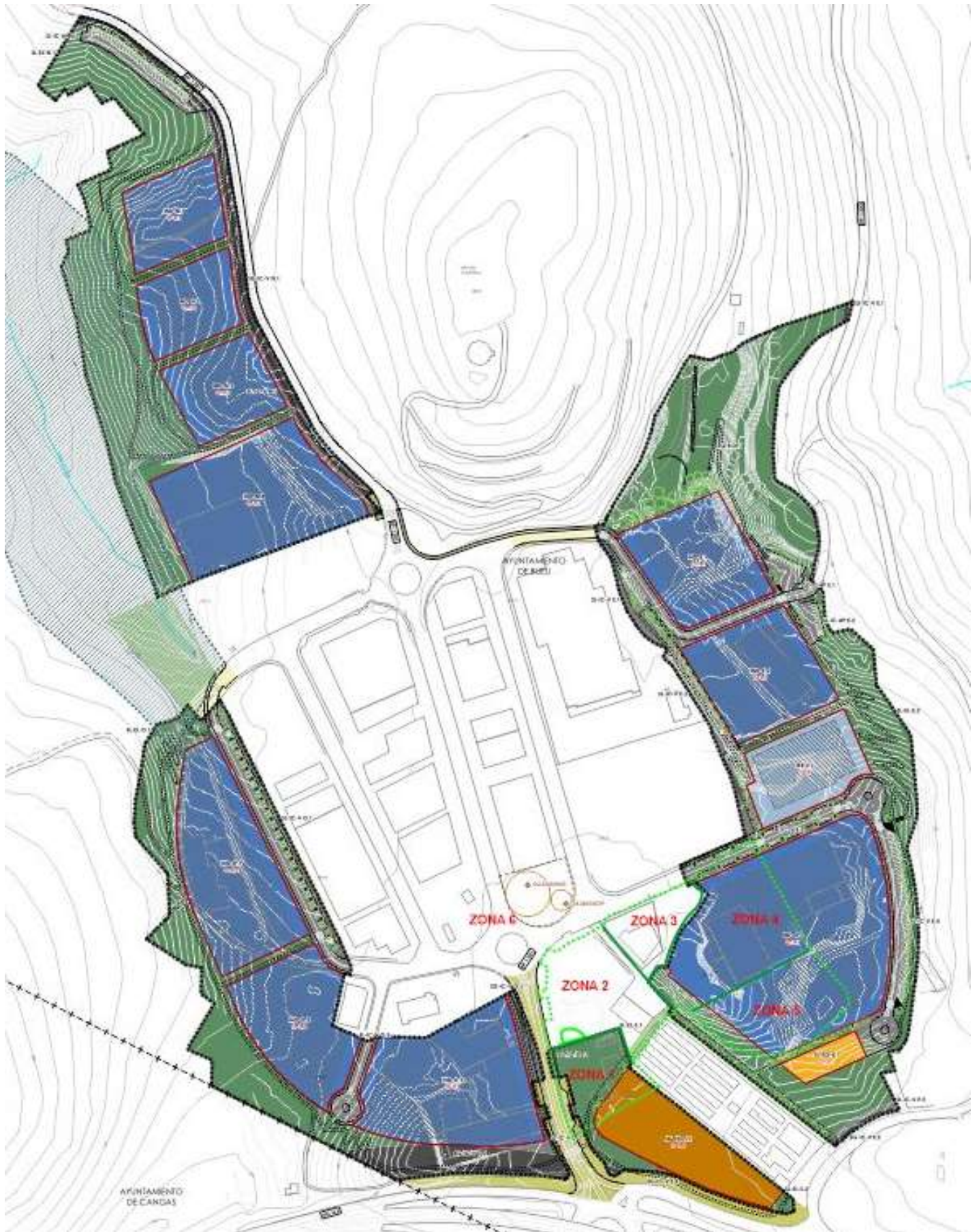
Detalle do plano do ámbito de ampliación do Parque Empresarial Castiñeiras coas diferenzas de uso do solo e a superposición das zonas prospectadas dentro do Entorno de Protección da Mámoa de Tomada de Martínez 2 establecido no PXOM de 2017