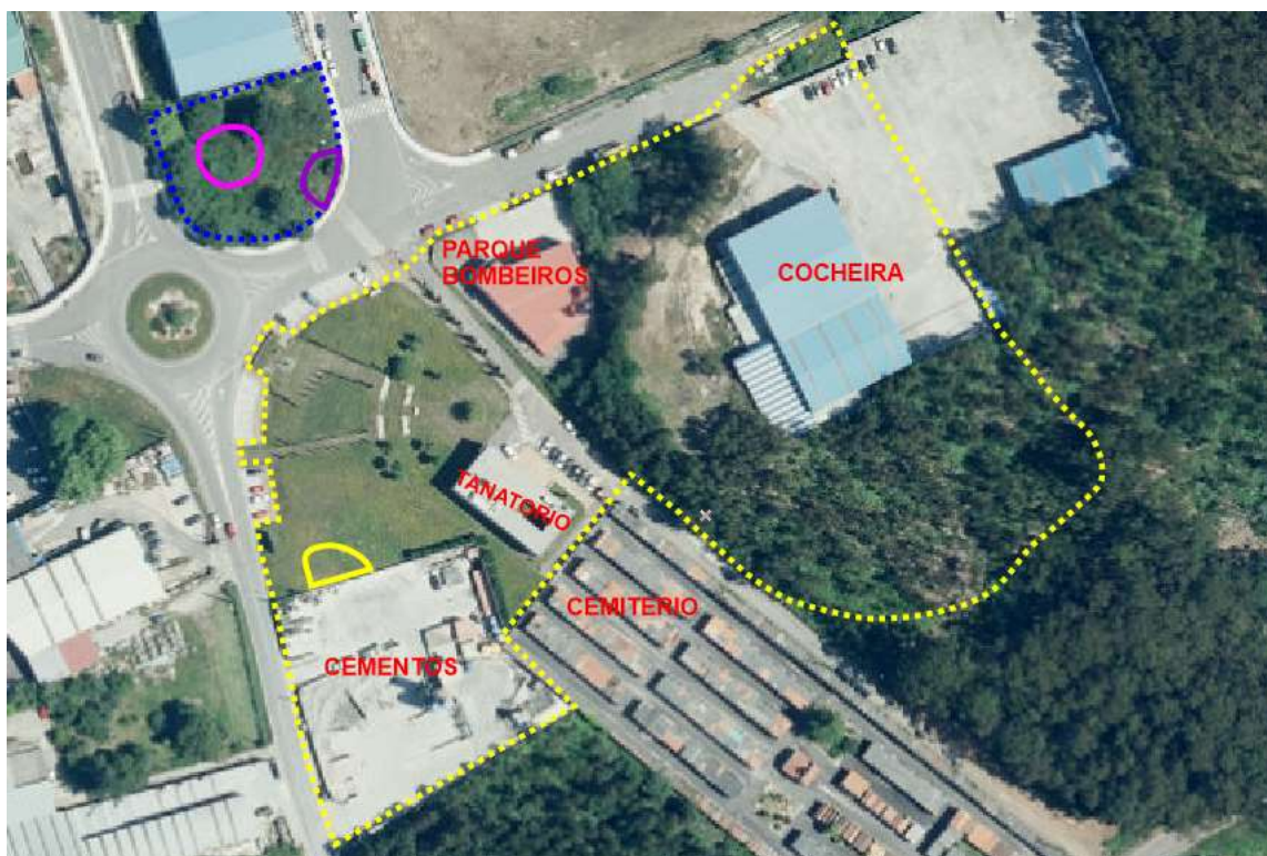
Situación de construcións dentro do Entorno de protección establecido na ficha de catalogación do PXOM (2017)