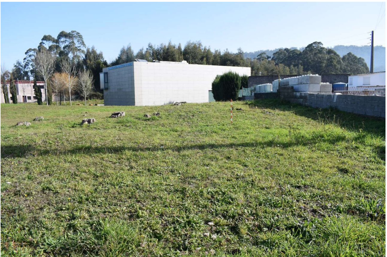
Mámoa de Tomada de Martínez 2 (GA36004018) desde o oeste. Obsérvase o corte da mámoa polo seu sur debido á implantación do muro de peche da planta de cemento. Á esquerda obsérvase, ao fondo, o Parque de Bombeiros, na zona central o Tanatorio e á dereita a parcela da planta cementeira.