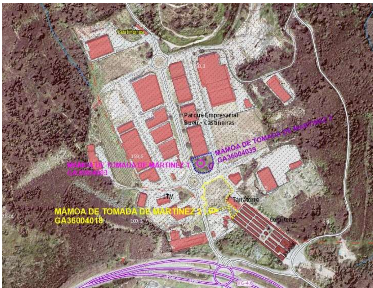
Proposta de redefinición de entornos de protección (Vectorial 2020)