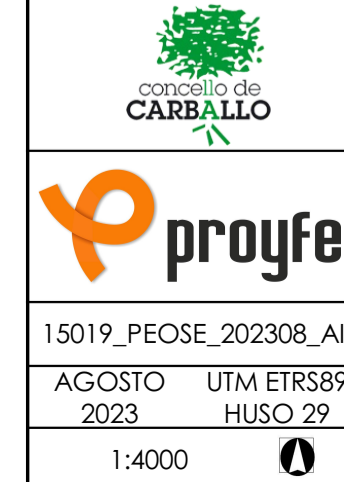
GRÁFICO DE HOJAS

NOTA: FUENTE PLANOS AS BUILT OBRA DE URBANIZACIÓN PARQUE EMPRESARIAL CARBALLO. FONTE PLANOS AS BUILT OBRA DE URBANIZACIÓN PARQUE EMPRESARIAL CARBALLO.